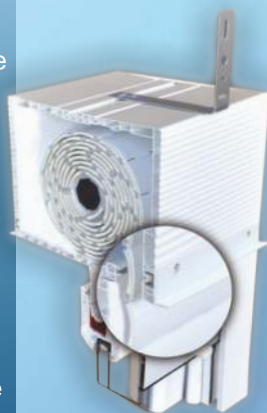
TL1000 ® z kotwieniem górnym i listwą tynkową